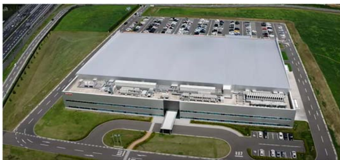
2021年4月に竣工した本社・友部事業所