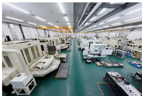
ダイセツ（モールドベース）内製部門