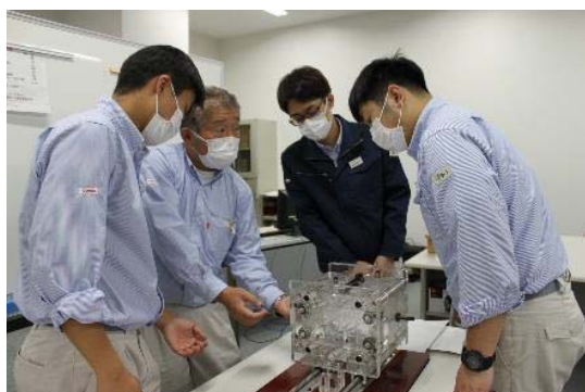
名匠による新入社員教育